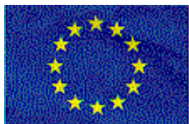
Unione Europea Fondo Sociale Europeo