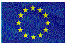
Unione Europea Fondo Sociale Europeo