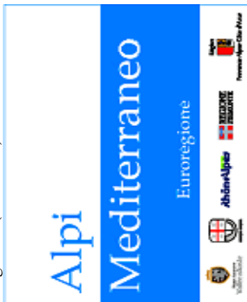
Allegato A (Articolo1)