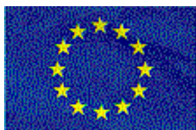
Unione Europea Fondo Sociale Europeo